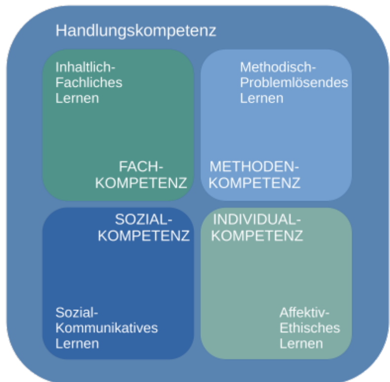
Abb. ##: Kompetenzmodell

Diese Definition der Handlungskompetenz ähnelt sehr stark der zuvor genannten Definition von Kompetenzen allgemein. Daher ist es eine naheliegende Idee das Kompetenzmodell entsprechend anzupassen und Fach-, Methoden-, Sozial- und Selbstkompetenz als Teilkompetenzen der Handlungskompetenz zu verstehen. Das Kompetenzmodell lässt sich in dieser Form auf die berufliche, vorberufliche, allgemeine und Hochschulbildung anwenden.