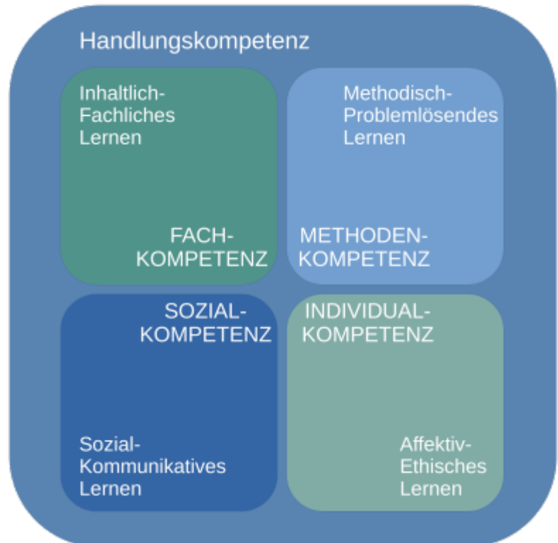
Abb. ##: Kompetenzmodell

Diese Definition der Handlungskompetenz ähnelt sehr stark der zuvor genannten Definition von Kompetenzen allgemein. Daher ist es eine naheliegende Idee das Kompetenzmodell entsprechend anzupassen und Fach-, Methoden-, Sozial- und Selbstkompetenz als Teilkompetenzen der Handlungskompetenz zu verstehen. Das Kompetenzmodell lässt sich in dieser Form auf die berufliche, vorberufliche, allgemeine und Hochschulbildung anwenden.